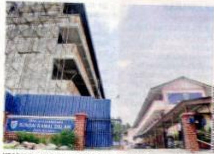
KEADAAN tapak pembinaan blok bangunan baru yang tidak mementingkan faktor keselamatan di Sekolah Kebangsaan Sungai Ramal.

"Sebenarnya, projek pembinaan itu dikategorikan sebagai projek sakit kerana ia dijadualkan siap Disember tahun lalu, tetapi sehingga