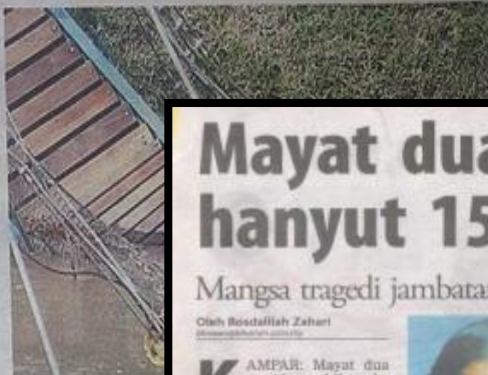
SEORANG anggota Unit SP pemeriksaan pada jambatan