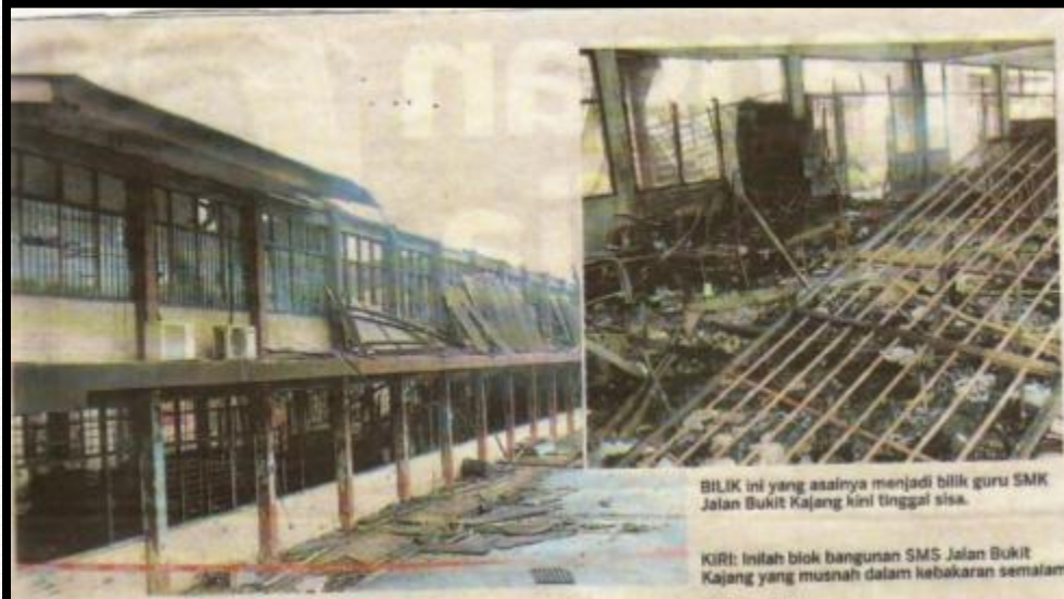
BILIK ini yang asalnya menjadi bilik guru SMK Jalan Bukit Kajang kini tinggal sisa.