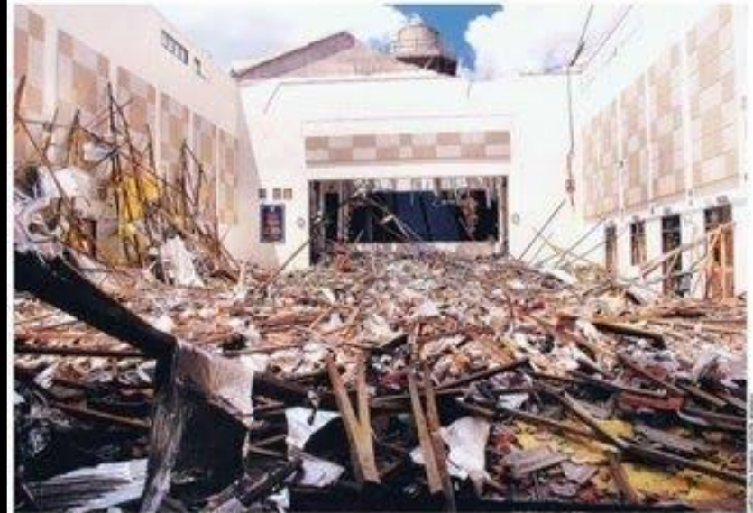
BERTABURAN: Keadaan beres-bereskan di Dewan Besar SMK Wakaf Tapai selepas bumbung runtuh, semalam.