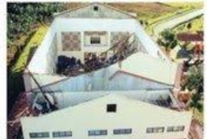
LIHAT BUKA 2 LAPPANG: Keadaan Dewan SMK Wakaf Tapai selepas bumbungnya runtuh.

Tan kejadian luar biasa dan satu perkara yang perlu diawasi perhatian oleh kontraktor serta pemaju. Saya berharap bangunan sekolah lain terutama dewan yang