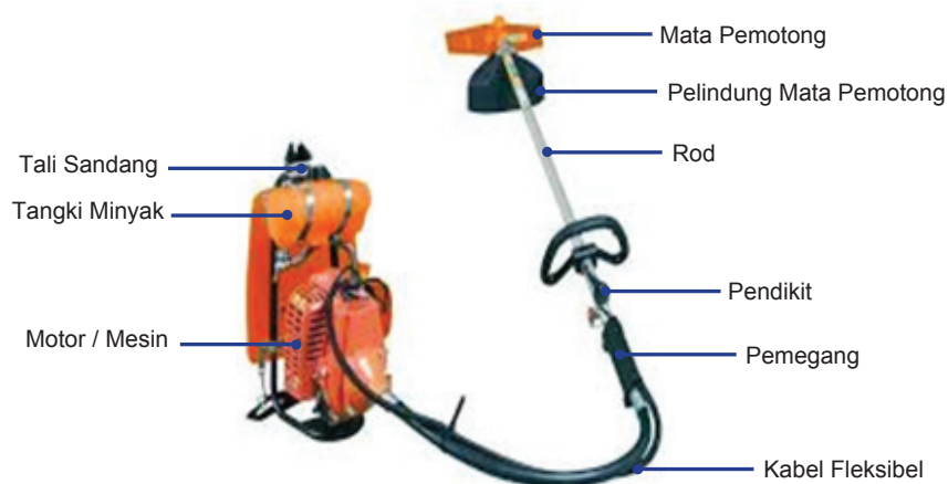
Rajah 1: Peralatan dan kelengkapan bagi mesin rumput sandang