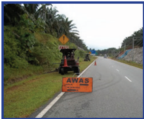
Rajah 6: Kon dan Papan Tanda Amaran