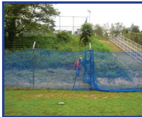
Rajah 7: Jaring sebagai pengadang