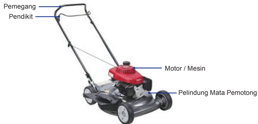
Rajah 2: Peralatan dan kelengkapan bagi mesin rumput sorong.