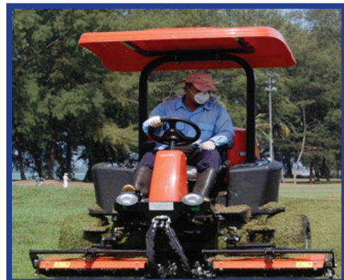
Rajah 3b: Riding Mower