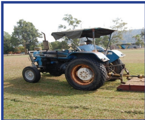
Rajah 3a: Tractor Lawn Mower