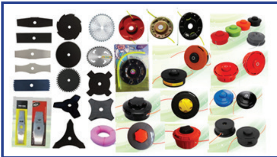
Rajah 4: Jenis-jenis Mata Pemotong Mesin Rumput

Terdapat satu jenis mata mesin rumput sorong yang sering digunakan iaitu jenis logam. Ianya mudah ditukar ganti dan ketinggian boleh dilaraskan mengikut panjang rumput yang dikehendaki.